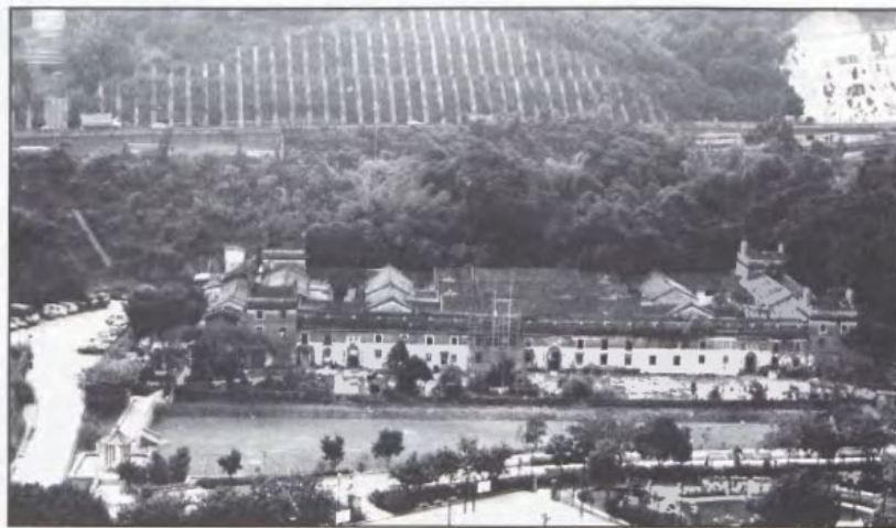
在沙田的迅速發展下，曾大屋的古樸氣息並未為繁華所侵。

村內以大紅花欄迎接迎賓的盛況，場面十分熱鬧。時移世易，滄海桑田，昔日的天井現已加蓋成房子，原本用作煮食的灶池亦拆掉了。