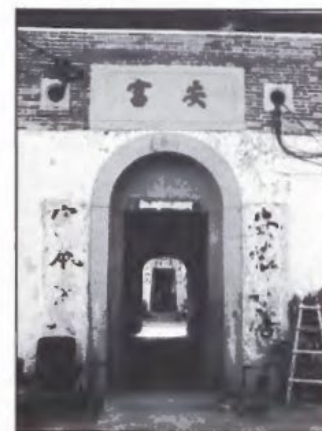
昔日傳統建築「拱門」仍在